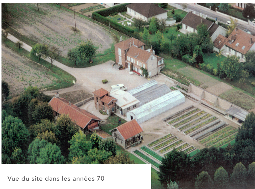
Vue du site dans les années 70

L'unité d'addictologie Jean Schiffer de niveau 2 (niveau de recours) assure les sevrages complexes. Son équipe pluri-professionnelle accompagne les patients dans leur démarche d'abstinence. Le patient est pris en charge par l'unité d'addictologie après consultation auprès d'une structure d'addictologie.