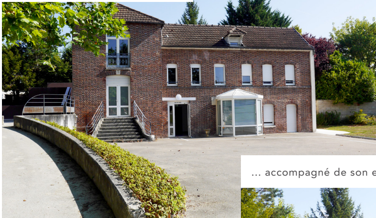
... accompagné de son extension