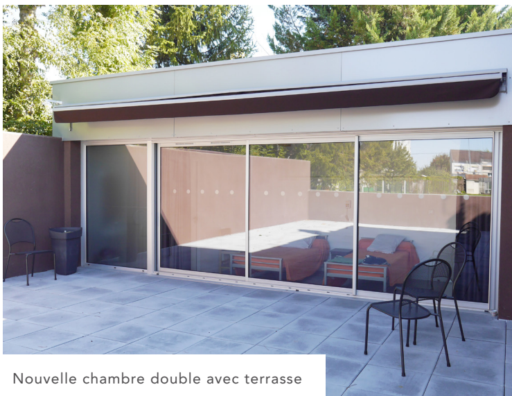
Nouvelle chambre double avec terrasse