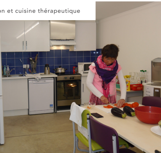
Salle de restauration et cuisine thérapeutique