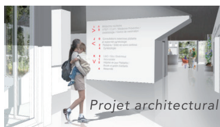
Hall d'accueil du bâtiment mère et enfant.

Les aménagements extérieurs offrent un nouveau visage au bâtiment comprenant une grande structure métallique avec effet miroir permettant d'abriter les usagers. Pour agrémenter ce beau paysage, les espaces verts seront prochainement aménagés.