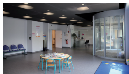
Hall d'accueil du service médecine nucléaire, Centre TEP et consultation thyroïde.